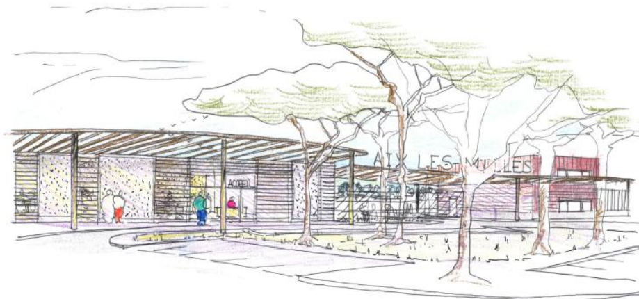
VUE EXTERIEURE - ENTREE VILLE

Afin de compléter les services, Il est également prévu la mise en place d'un balisage de piste et l'éclairage des voiries aéronautiques et non aéronautiques du site.