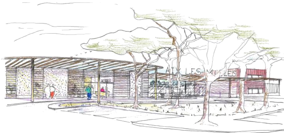
VUE EXTERIEURE - ENTREE VILLE

Afin de compléter les services, Il est également prévu la mise en place d'un balisage de piste et l'éclairage des voiries aéronautiques et non aéronautiques du site.